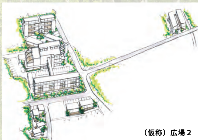
(仮称) 広場 2